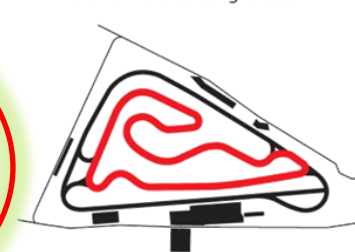
VAR. 6 – Dĺžka/Long: 3 223 m