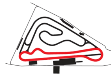
VAR. 3 – Dĺžka/Long: 2 632 m