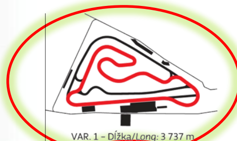
VAR. 1 – Dĺžka/Long: 3 737 m