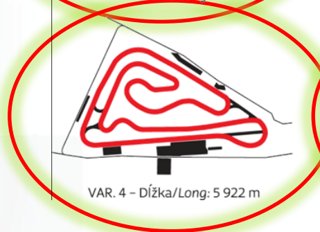
VAR. 4 – Dĺžka/Long: 5 922 m