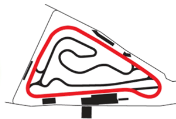
VAR. 2 – Dĺžka/Long: 3 034 m